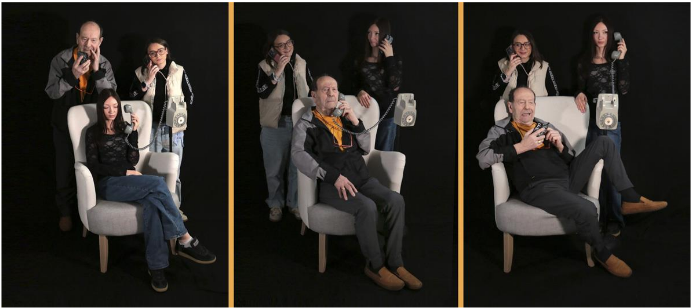
4 - Allo ? Allo.... Allo ! , 2026