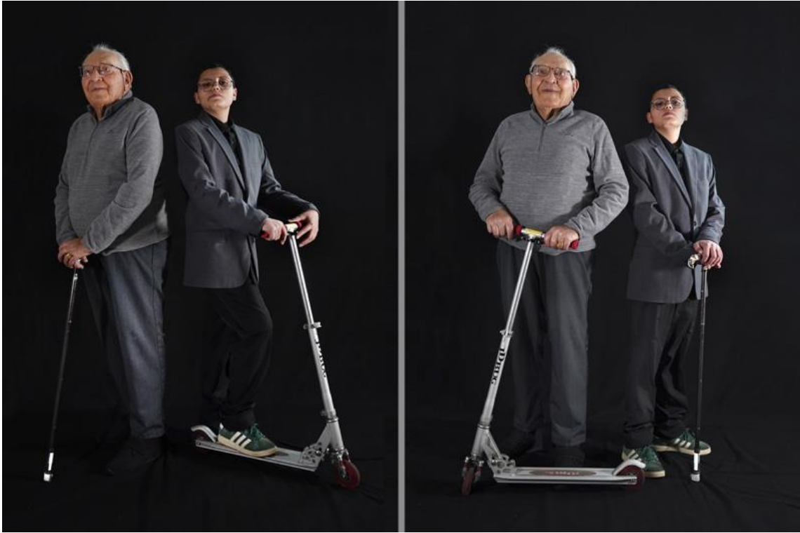
3 - En route ! , 2026