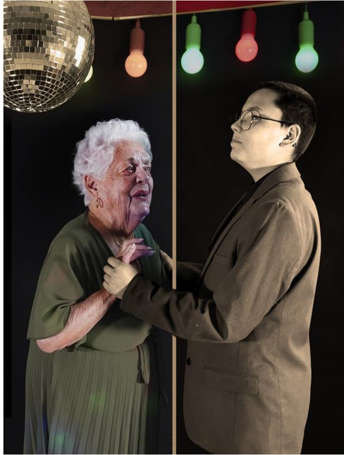
5 - Le bal , 2026