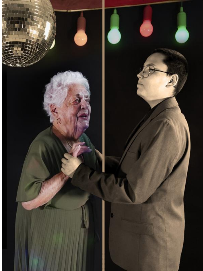
5 - Le bal , 2026