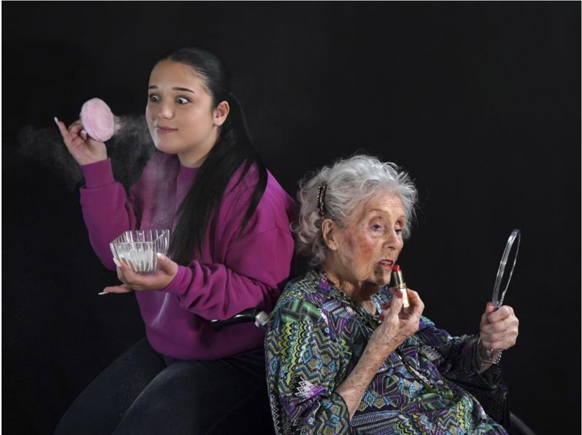
1 - La plus belle pour aller danser , 2026.