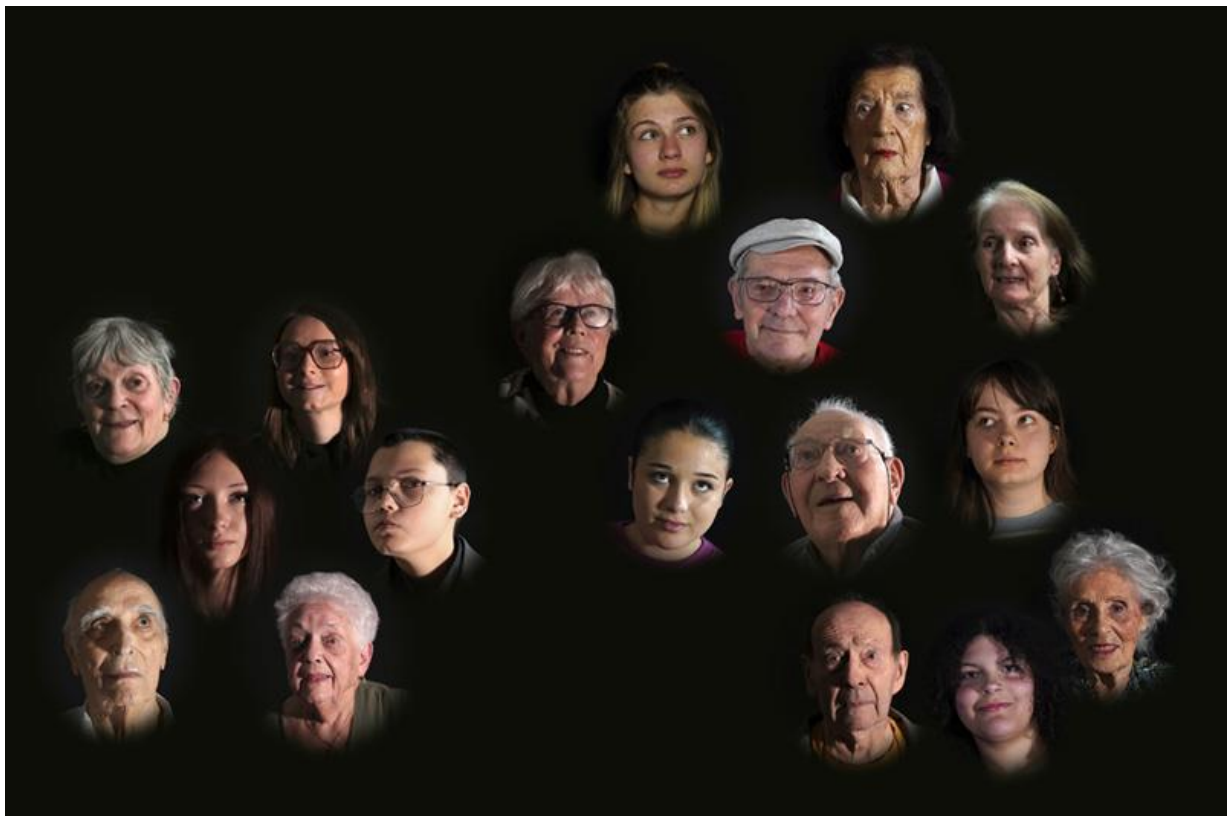
10 – Ensemble , 2026