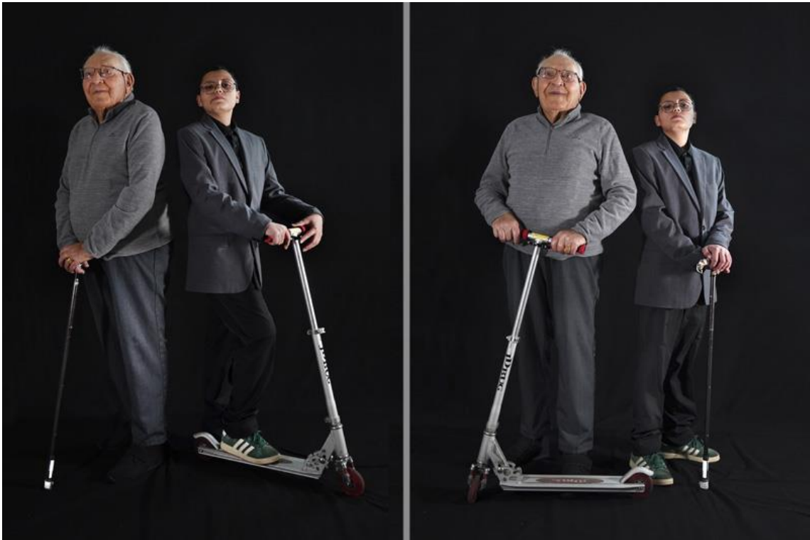
3 - En route ! , 2026