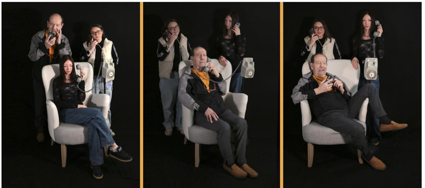
4 - Allo ? Allo.... Allo ! , 2026