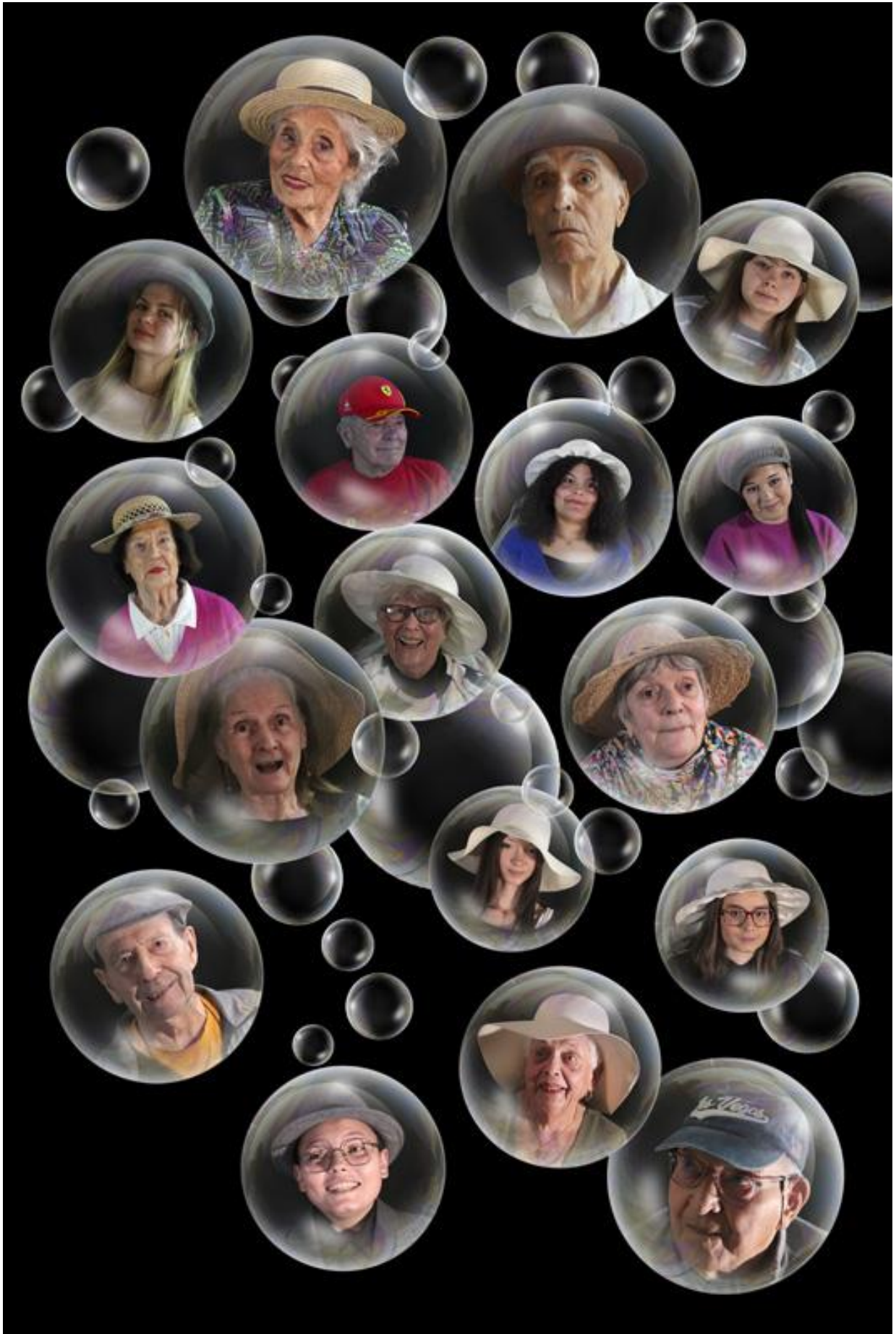
11 - Ça pétille !, 2026