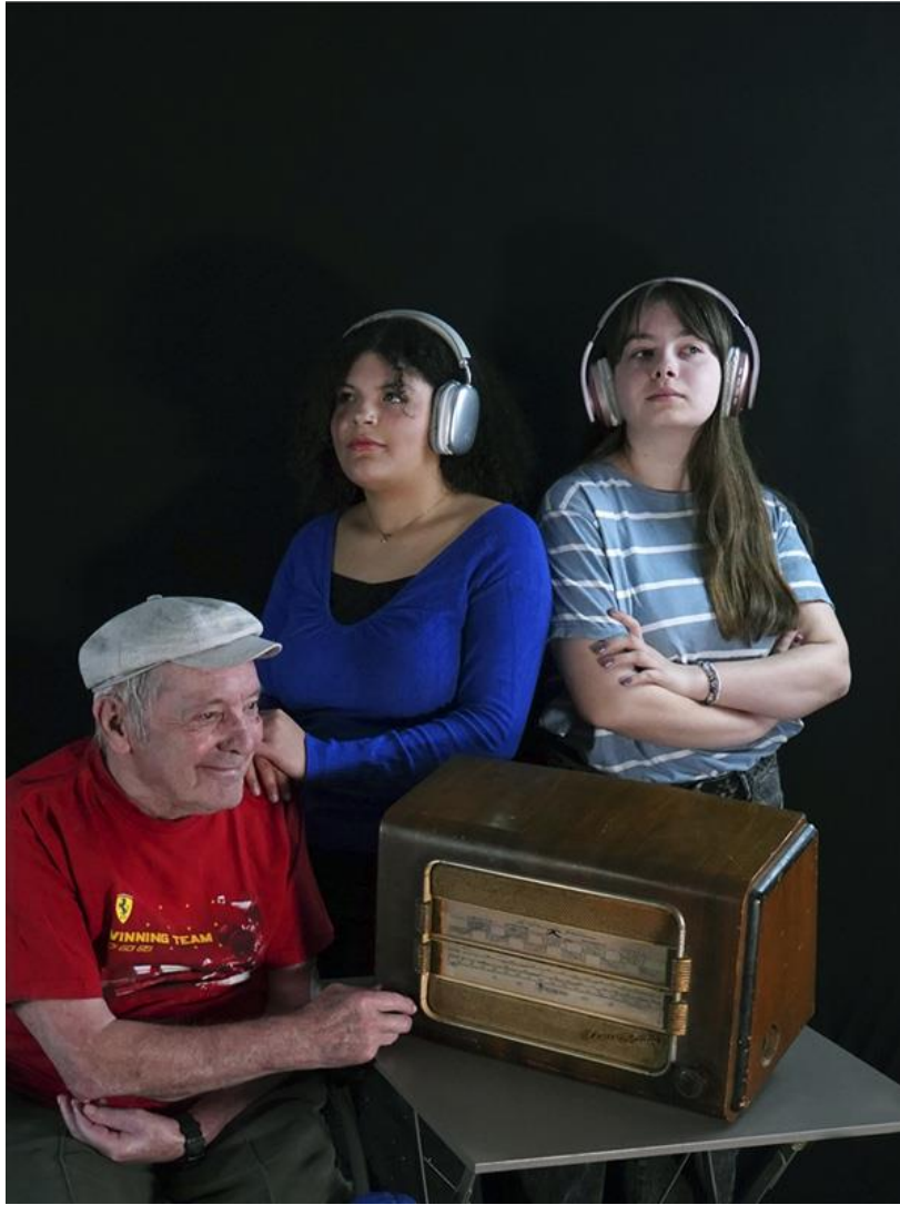
7 - Entendons-nous bien ! , 2026