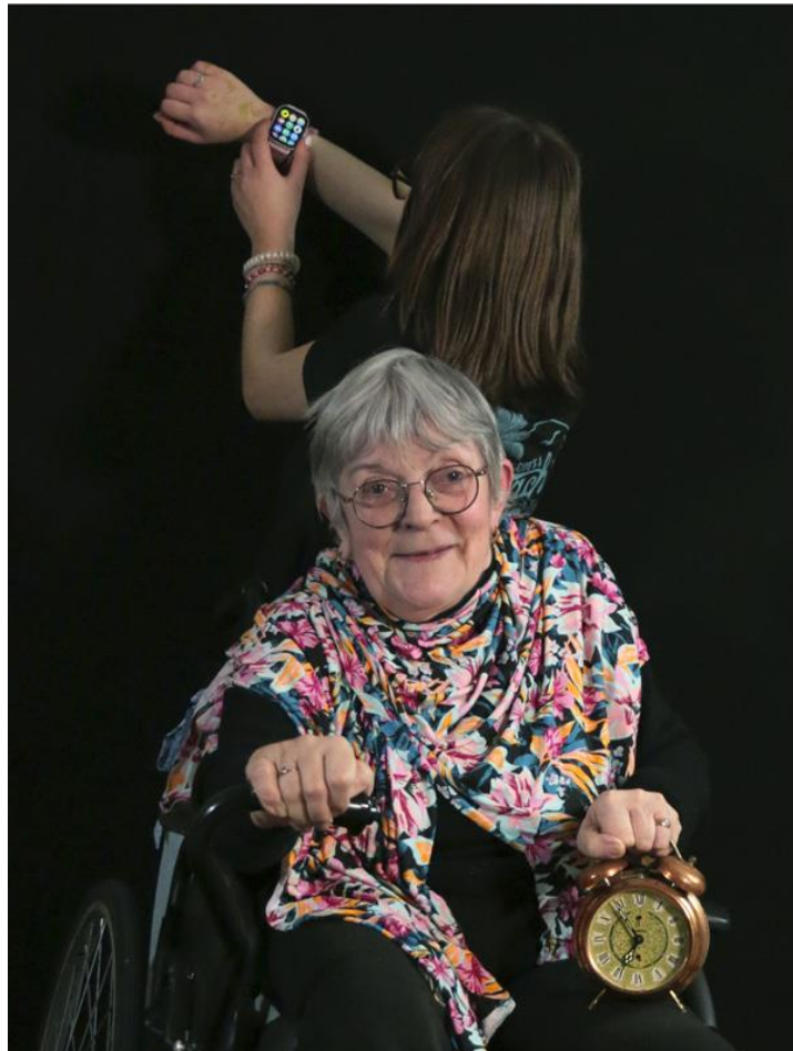
6- Il est temps... , 2026