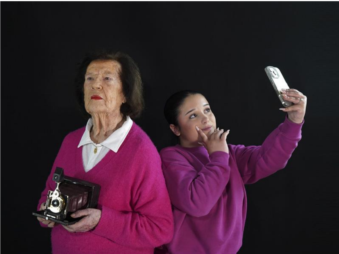
2 - Selfies ? , 2026